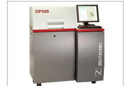
カラーアーカイブレコーダー