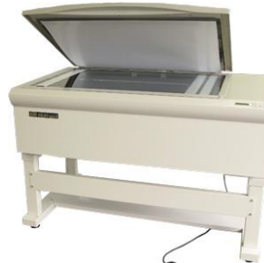
フラットベッドスキャナー