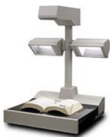
ブックスキャナー