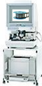
リーダープリンター