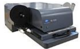
カラーフィルムスキャナー